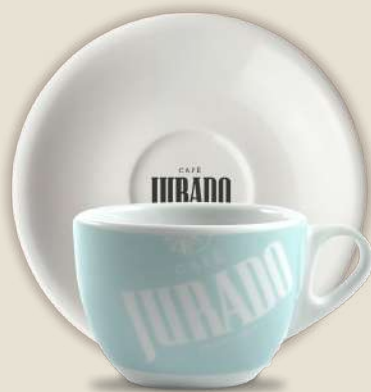
CAFÉ CON LECHE

REF. 30018679 Pack Verde/Rosa REF. 30018754 Pack Amarillo/Azul