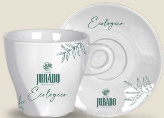
CAFÉ CON LECHE