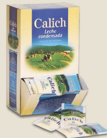
LECHE CONDENSADA ENTERA