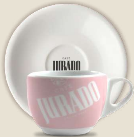
CAFÉ CON LECHE BIG