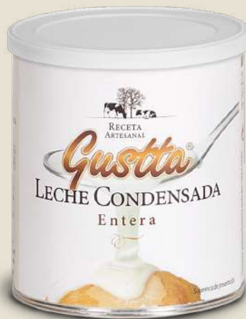
LECHE CONDENSADA ENTERA