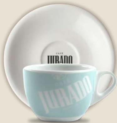
CAFÉ CON LECHE

REF. 30018679 Pack Verde/Rosa REF. 30018754 Pack Amarillo/Azul