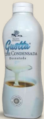
LECHE CONDENSADA DESNATADA