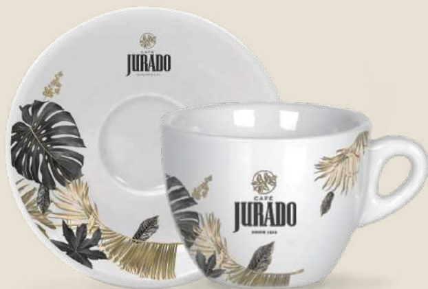
CAFÉ CON LECHE