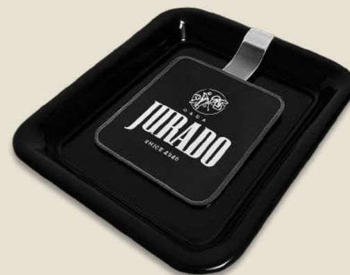
BANDEJA DE CAMBIO

Con plástico portamenú en lateral (gama alta)