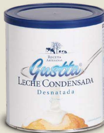
LECHE CONDENSADA DESNATADA