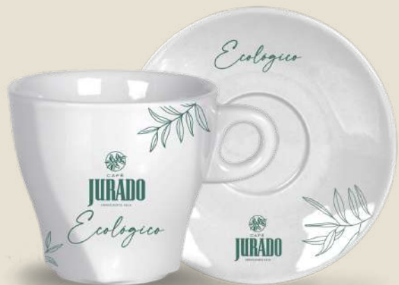
CAFÉ CON LECHE